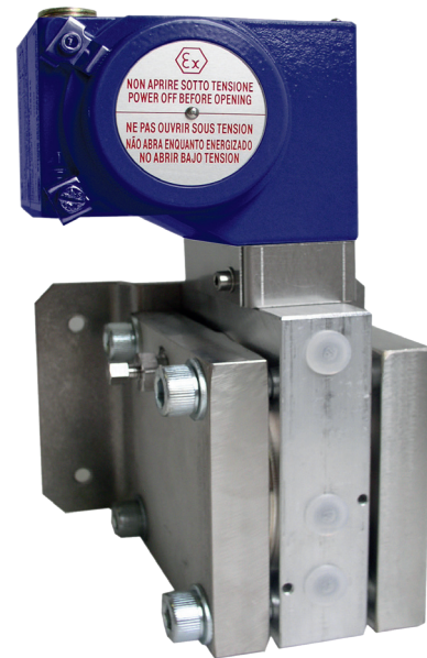
Переключатель дифференциального давления, модель DC

Для обеспечения максимальной гибкости эксплуатации переключатели дифференциального давления оснащены микропереключателями, допускающими непосредственную коммутацию электрических нагрузок до 250 В перем. тока, 10 А.