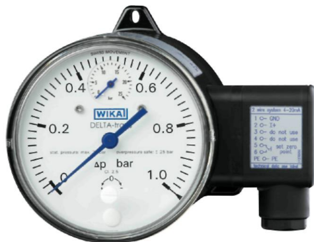
Преобразователь дифференциального давления с индикацией дифференциального и рабочего давления, модель DPGT40