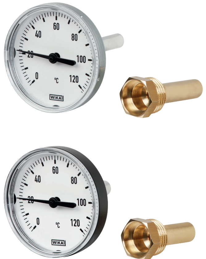
Сверху: Стальной корпус, оцинкованный Снизу: Пластиковый корпус

Модель А43 изготавливается с классом точности 2 в соответствии с EN 13190, что обеспечивает требуемую точность индикации для отопительной техники.