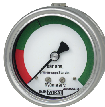
Индикатор плотности газа, модель GDI-063

Благодаря локальному индикатору приведенное к 20 °C [68 °F] значение давления может считываться непосредственно на приборе.