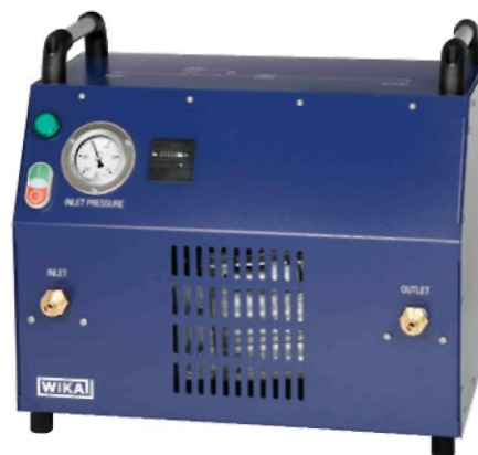
Переносной вакуумный компрессор для элегаза (SF 6 ), модель GVC-10