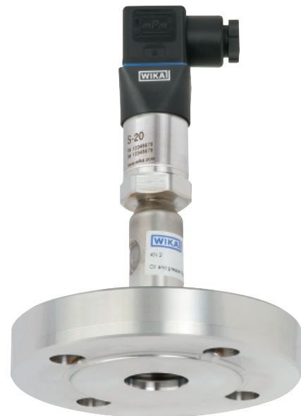
Система мембранных разделителей, модель DSS26T