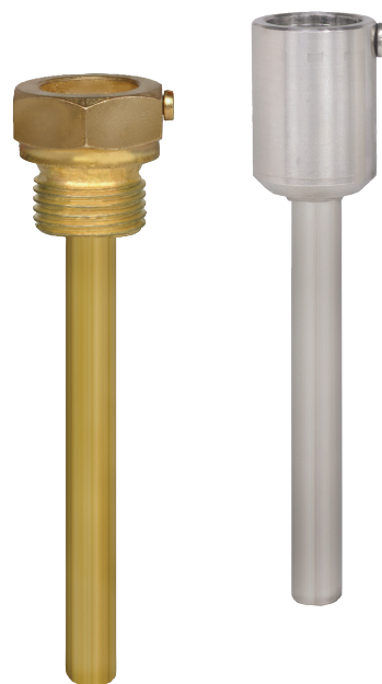
Рис. слева: Резьбовая защитная гильза Рис. справа: Защитная гильза со штоком под приварку

Благодаря практически неограниченным возможностям применения имеется огромное количество вариантов конструкций и материалов защитных гильз. Основным критерием различия конструкций является тип технологического присоединения и метод изготовления. В основном различают резьбовые защитные гильзы, гильзы под приварку и гильзы с фланцевым присоединением.