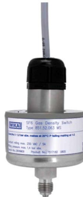
Реле плотности газа, модель 851.52.063 MS

Между 2 контактами: \geq 50 мбар Гистерезис переключения: как правило, 50 мбар